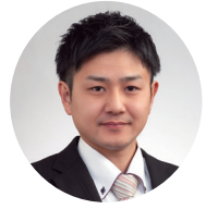
長岡鉄工業青年研究会 二〇二五年度会長